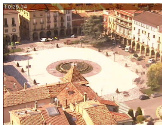
Plaça Fra Bernadí | Manlleu