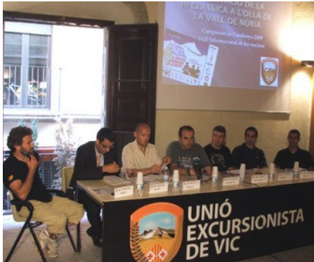
Imatge de la presentació de la cursa

| portada d'avui | notícies nacionals i internacionals | guia comercial | enllaços | viatjar | RSS