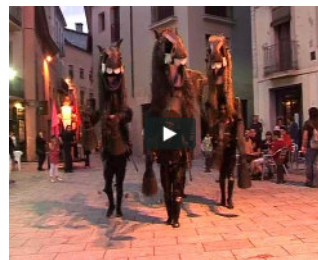
FESTUS 2009 (TORELLÓ)