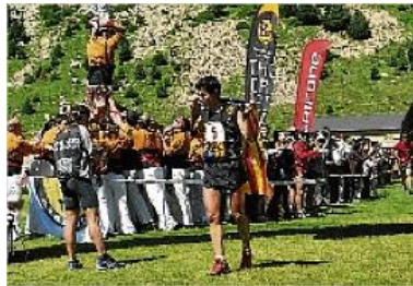
El ceretà Kilian Jornet va aconseguir el primer lloc masculí

Un dels moments més emotius de l'Olla va ser la lectura d'un manifest per part de l'excampiona del món Anna Serra reclamant que la selecció catalana pugui tornar a competir internacionalment.